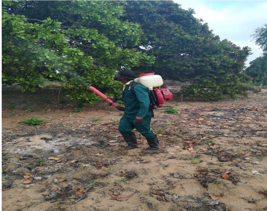
Fig 3: Pulverisation des anacardiers