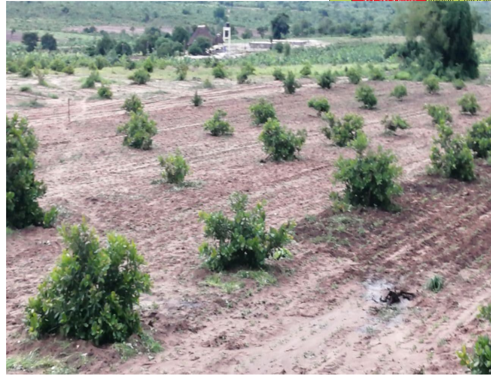
Fig 2. Plantation commerciale – Anacardiers polyclonale