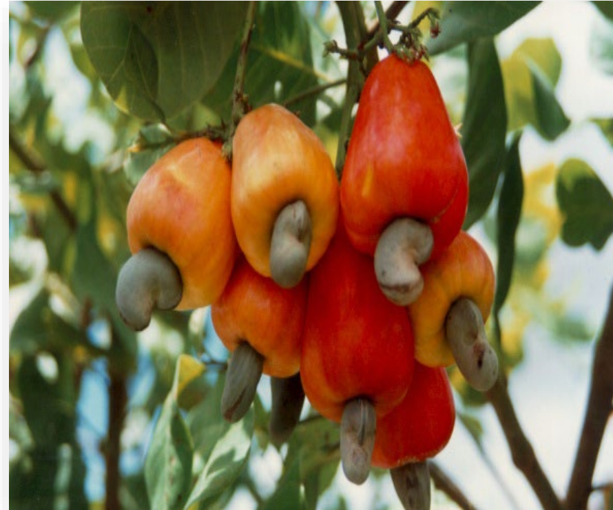
Fig 4. Anacardes