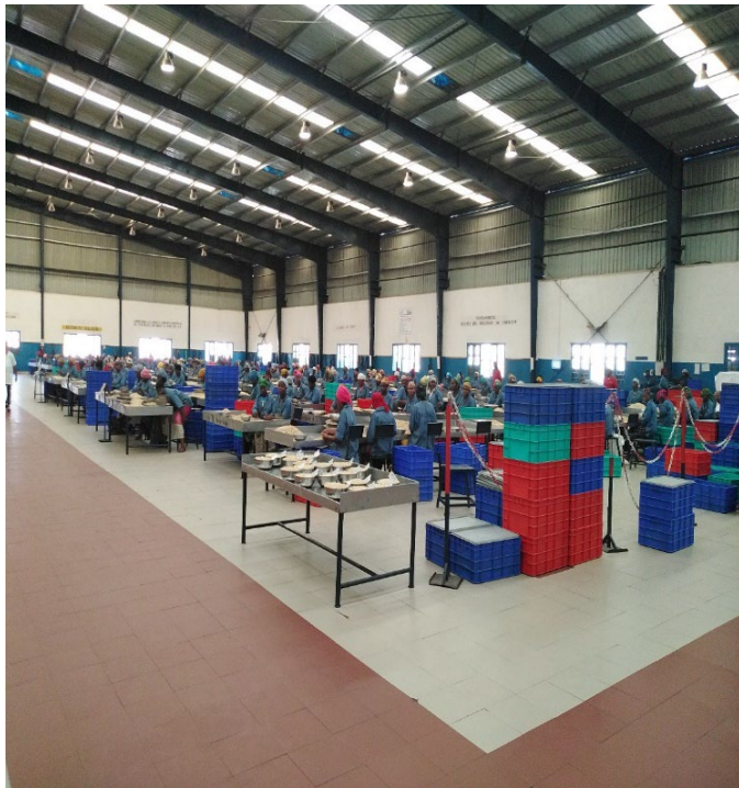
Fig 5: Usine de transformation