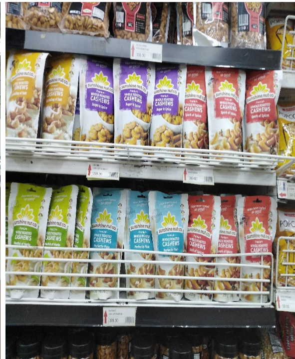
Fig 6. Amandes de cajou torréfiées