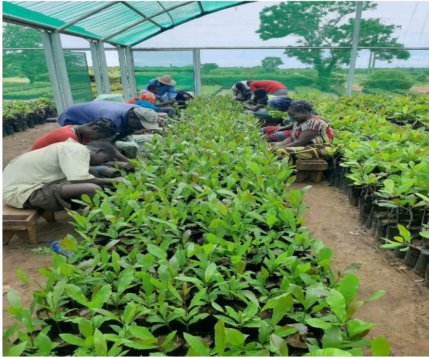
Fig 1: Pepiniere d'anacardiers