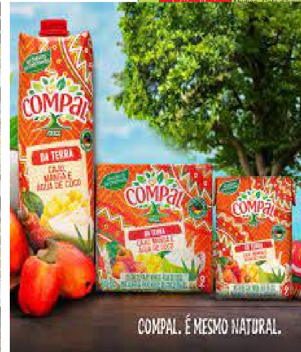
Fig 7. Jus d'anacardes